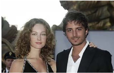
Tutte le coppie vip italiane dimenticate! (Alfemminile.com)