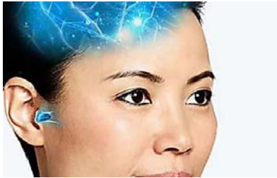
L'inglese per i pigri, dopo 2 ore parli come un madrelingua (fattiquotidiani.eu)